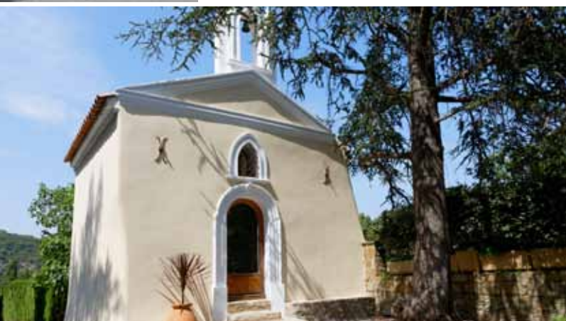
La chapelle Saint-Roch a retrouvé son éclat