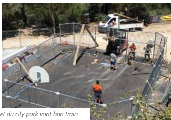
Les travaux du skate parc et du city park vont bon train