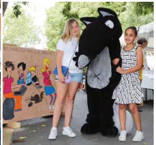
Visite de la mairie