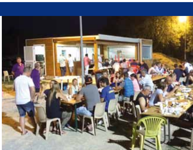
Le club de tennis a un nouveau bureau, avec des nouveaux membres très dynamiques, heureux de guider un club dont l'école de tennis fonctionne à merveille.