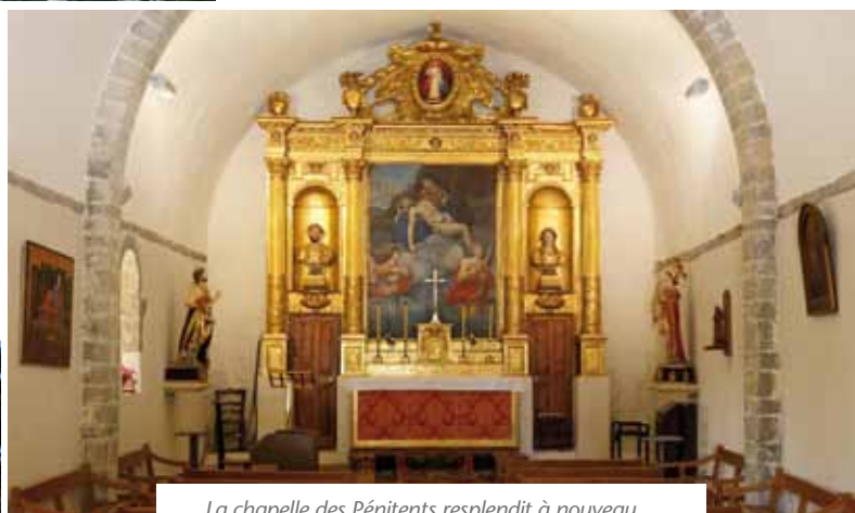
La chapelle des Pénitents respandit à nouveau, à l'intérieur (ci-dessus) et à l'extérieur (ci-dessous)