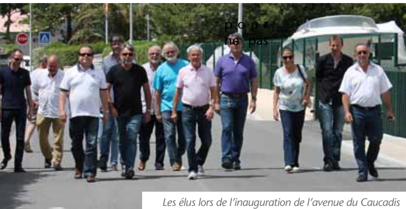
Les élus lors de l'inauguration de l'avenue du Caucadis