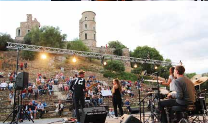
Ambiance de feu au château pour la fête de la musique, transformée en l'occasion en Grimaud Music Tour avec de jeunes musiciens en devenir et plein de sessions sympathiques !