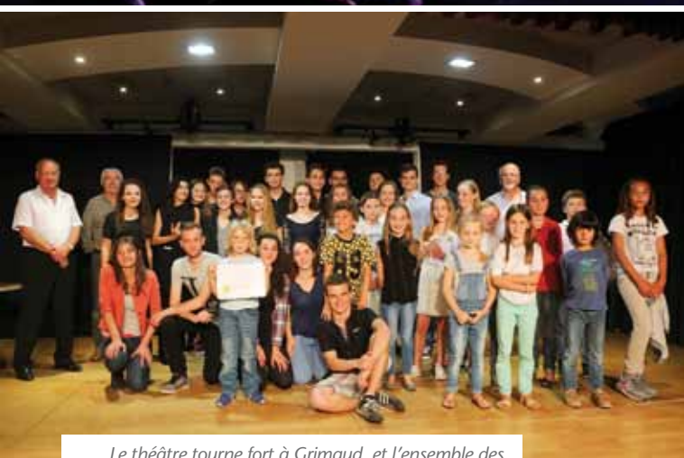
Le théâtre tourne fort à Grimaud, et l'ensemble des acteurs de cette activité ont été récompensés à la fin de la saison.